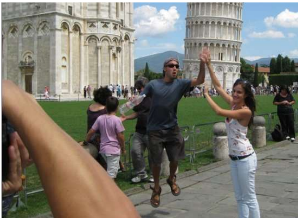
Obrázek 3. Pisa troll

Podle lokace můžeme odlišit trolling online a offline. Offline trolling se děje mimo počítačem zprostředkovanou komunikaci a je obvykle synchronní, to znamená, že akce i reakce probíhá ve stejném čase, obvykle prostřednictvím komunikace tváří v tvář. K nejznámějším příkladům offline synchronního trollingu patří tzv. Pisa trolling. Jde o obtěžování turistů, kteří se fotografují u šikmé věže v Pise se vztaženou rukou, což má na fotografii vyvolat dojem, že padající věž podpírají. Troll potom do natažené ruky a rozevřené dlaně plácá.