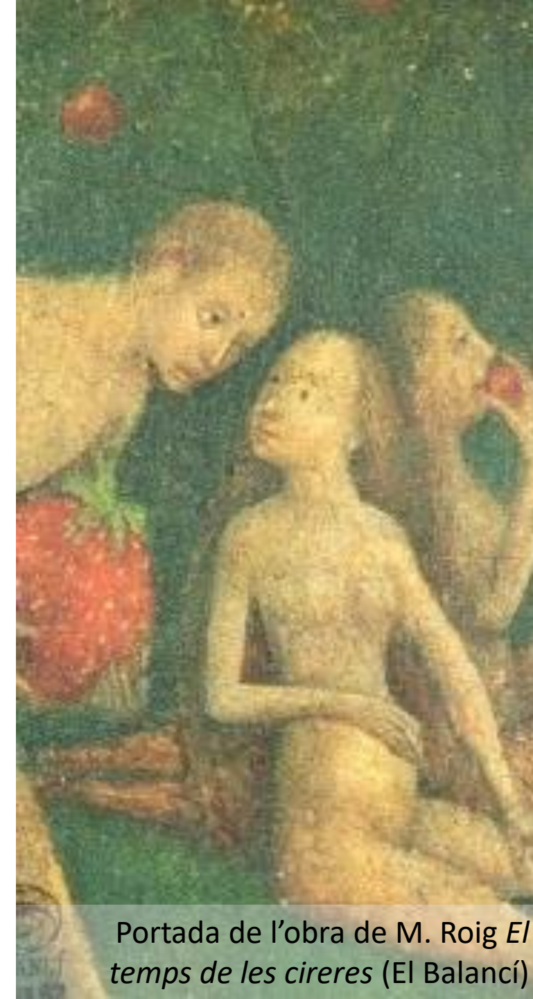
Portada de l’obra de M. Roig El temps de les cireres (El Balancí)

La temàtica acaba sent molt similar a la categoria que hem anomenat “narrativa transgressora”, només es diferencien en l’ús o no del textualisme (o altres formes innovadores).