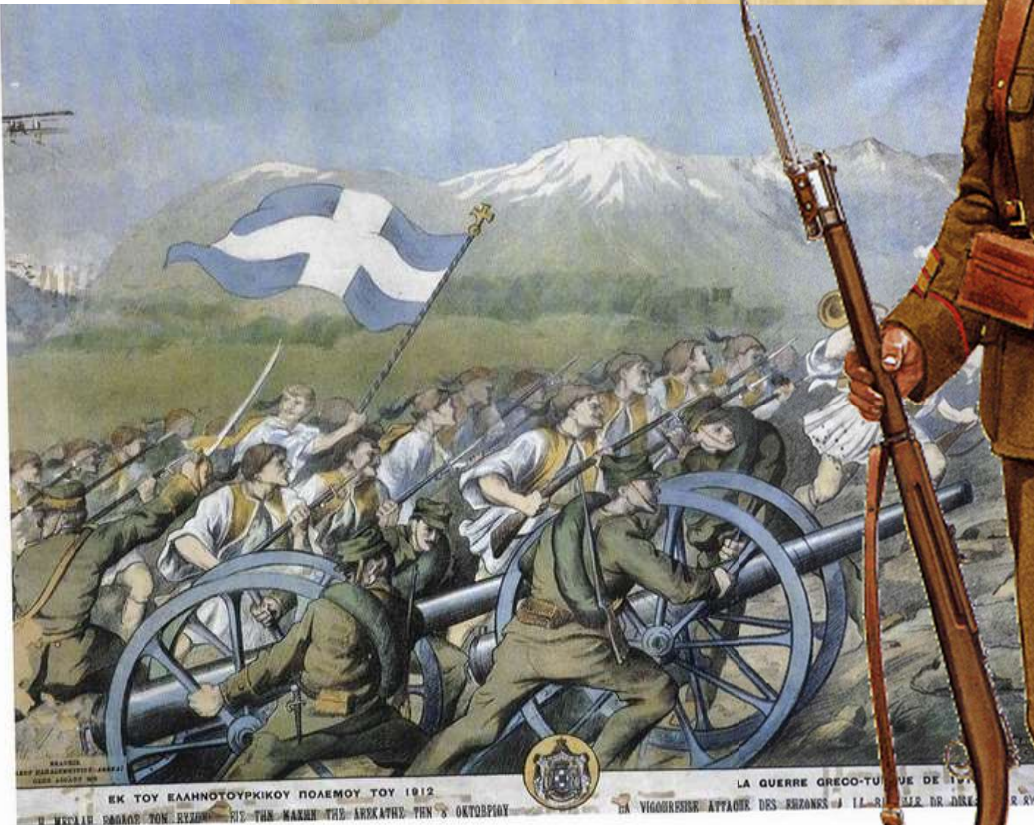
ΕΚ ΤΟΥ ΕΛΛΗΝΟΤΟΥΡΚΙΚΟΥ ΠΟΛΕΜΟΥ ΤΟΥ 1912 LA GUERRE GRECO-TURQUE DE 1912 Η ΜΕΓΑΛΗ ΣΠΙΛΙΣ ΤΩΝ ΕΥΖΩΝ ΣΤΙΣ ΤΗΣ ΜΑΧΗΣ ΤΗΣ ΑΡΧΑΪΗΣ ΤΗΝ 5 ΟΚΤΩΒΡΙΟΥ LA VIGOURESSE ATTAQUE DES EZONS A L'ARMEE DE JULES GEMEL