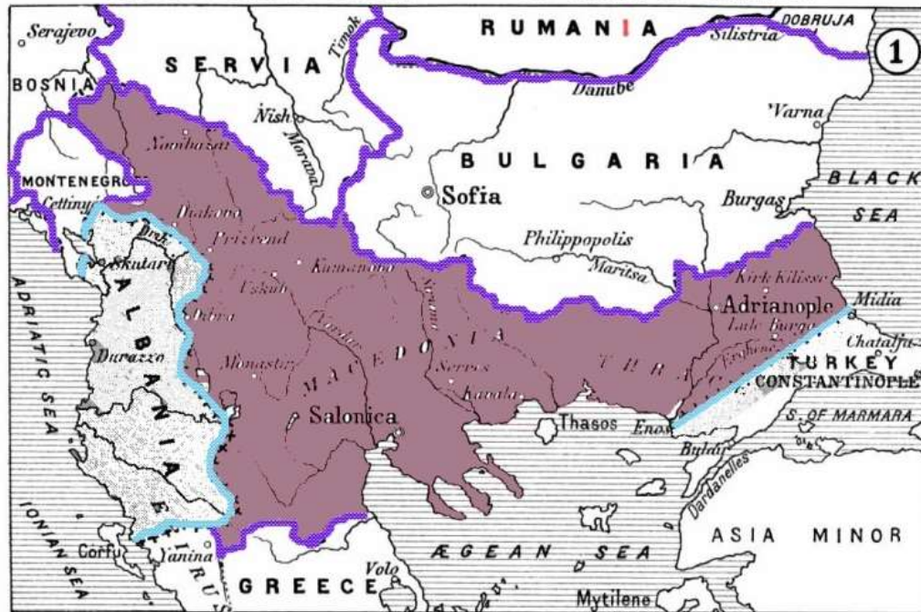
2. TREATY OF BUKAREST