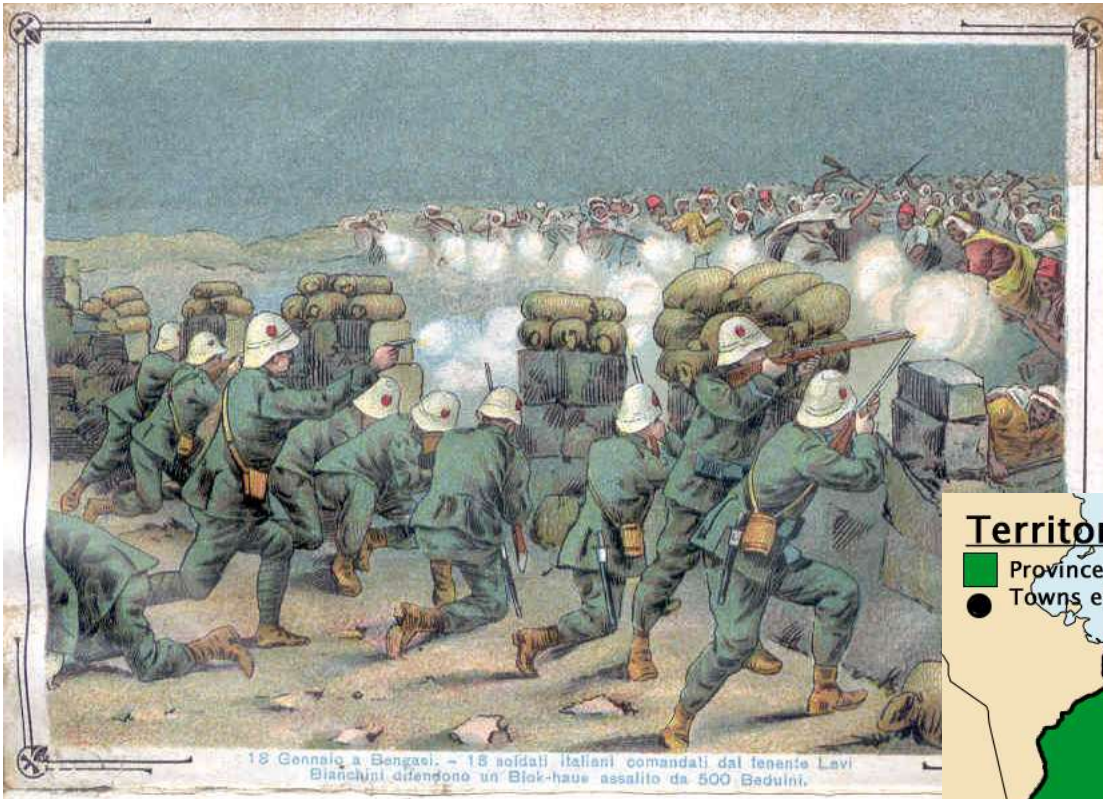
18 Gennaio a Bengasi. - 18 soldati italiani comandati dal tenente Lavi Bianchini difendono un Blok-haus assalito da 500 Beduini.