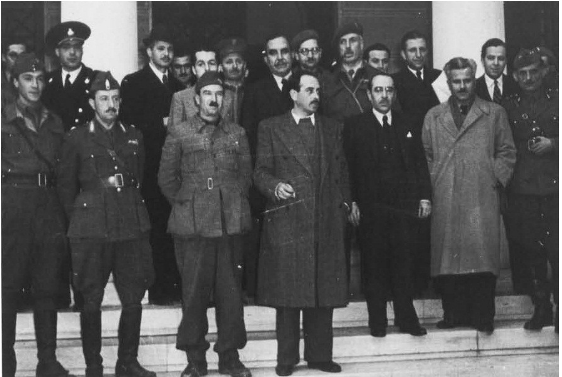
Varkiza 12. 2. 1945