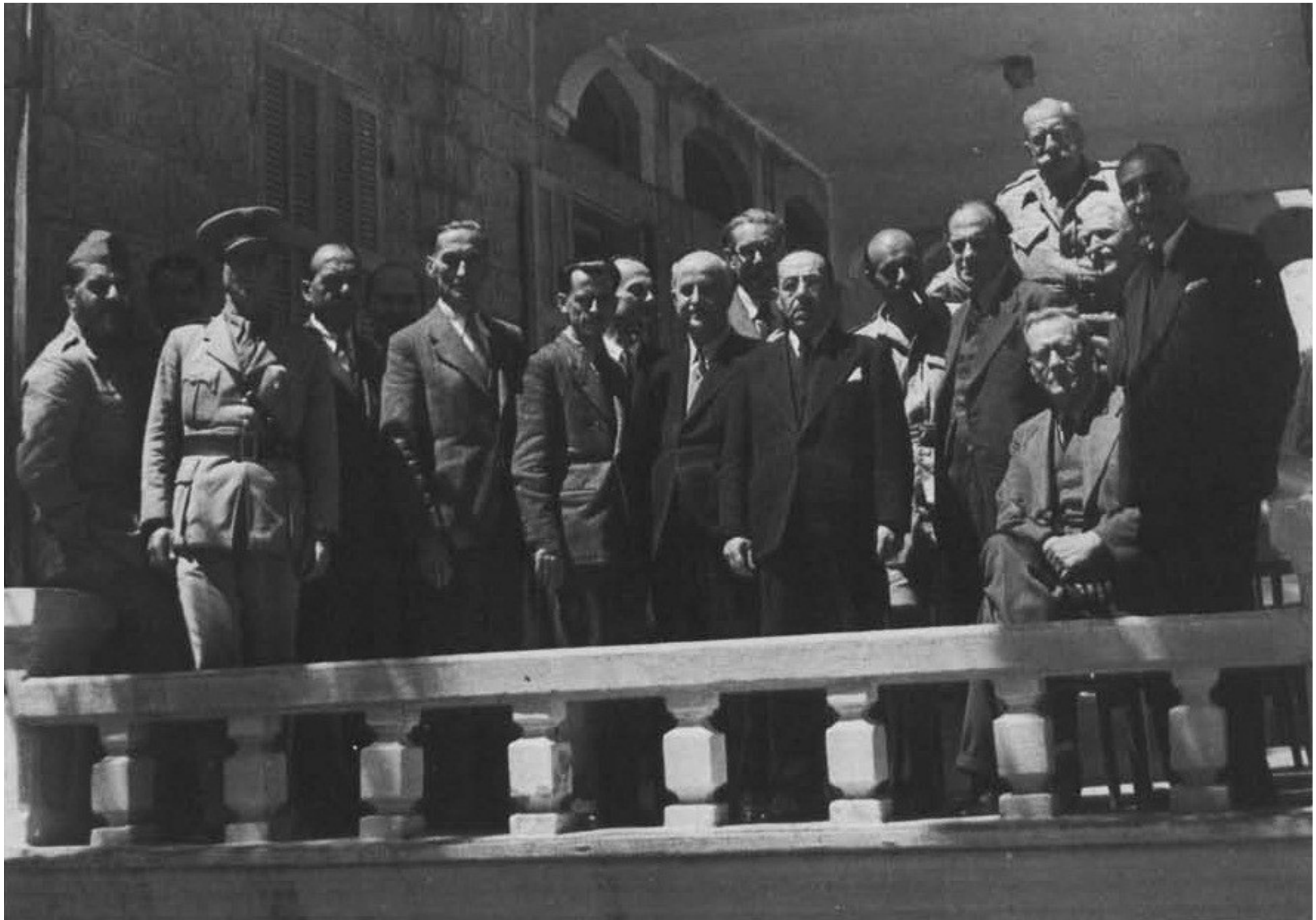
Libanonská konferencia – jednanie o vytvorení vlády „národnej jednoty“