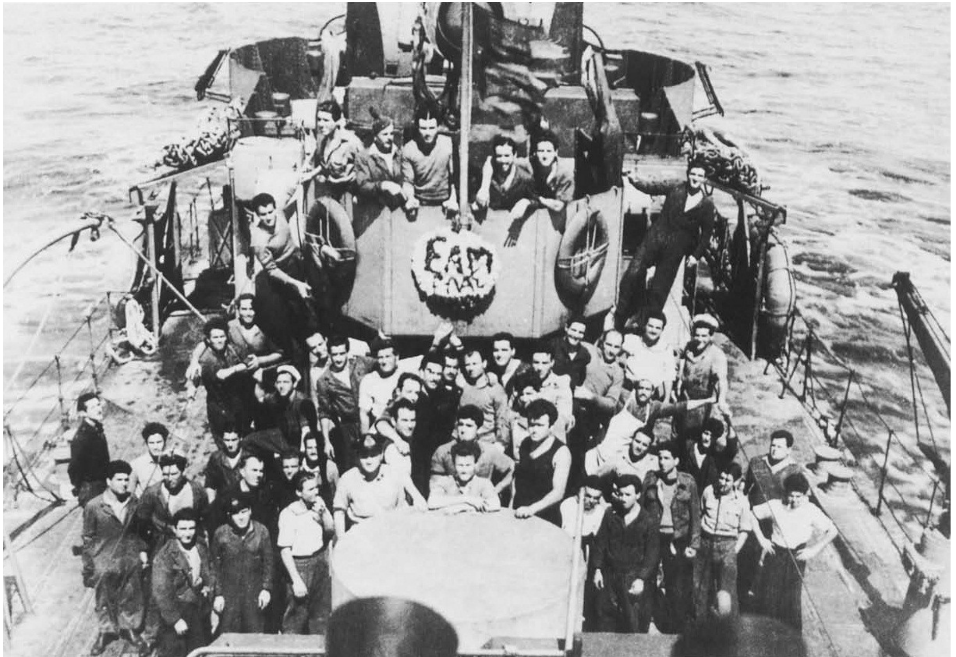
vzbura na torpédoborci Pindos – apríl 1944