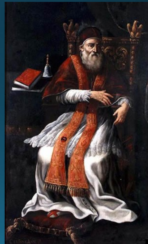
Pavol IV. (1555 – 1559)