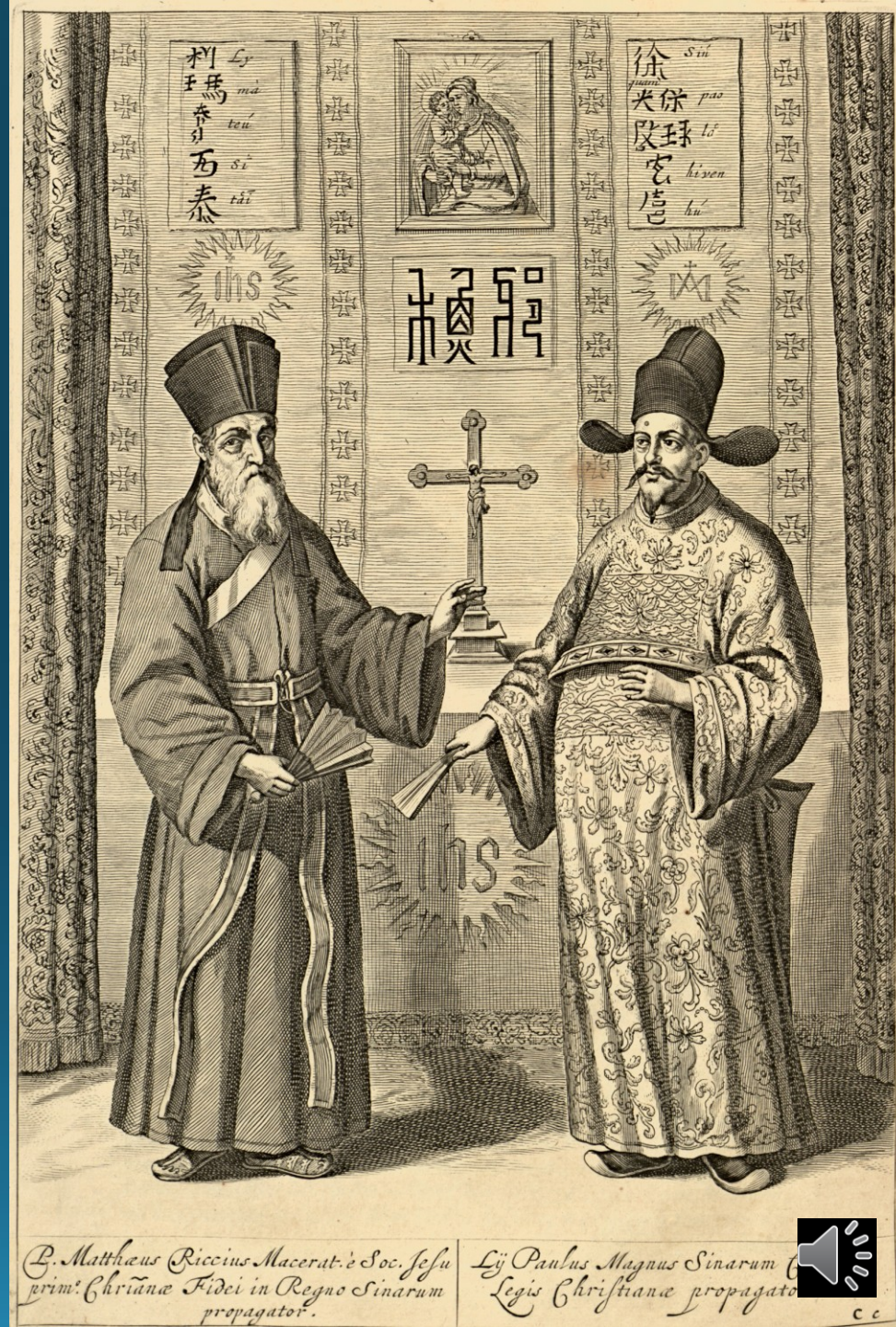
P. Mattheus Riccius Macerat. è Soc. Jesu prim. Christiana Fidei in Regno Sinarum propagator.