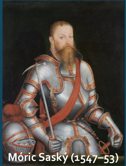
Móríc Saský (1547-53)