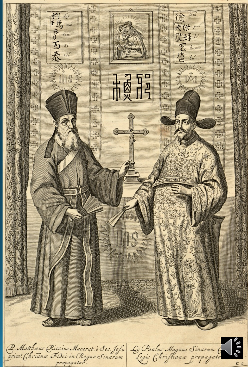
P. Mattheus Riccius Macerat. è Soc. Jeshu prim. Christiana Fidei in Regno Sinarum propagator.