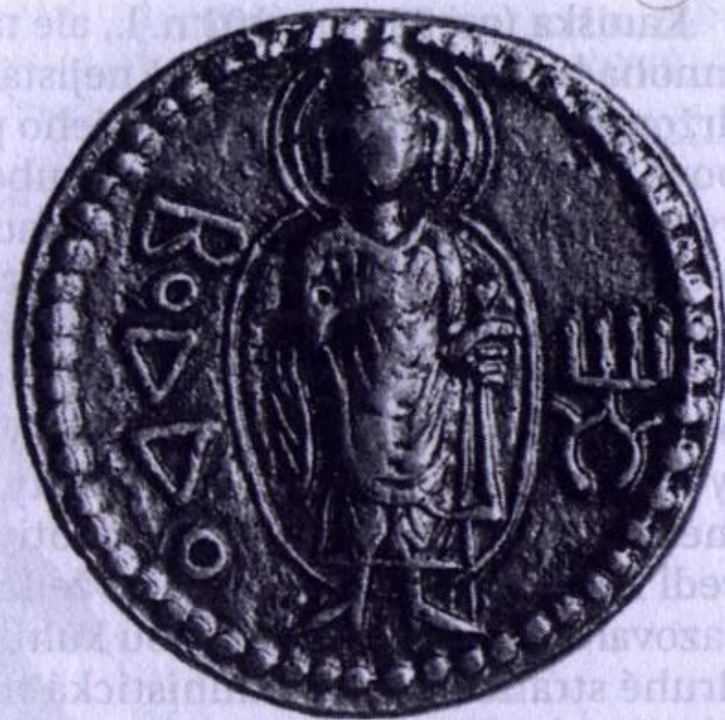
Kaniškův zlatý statér. Avers: Kaniška obětuje na oltáři. Revers: Buddha. Kušánské období, konec 1.– 2. století n. l.