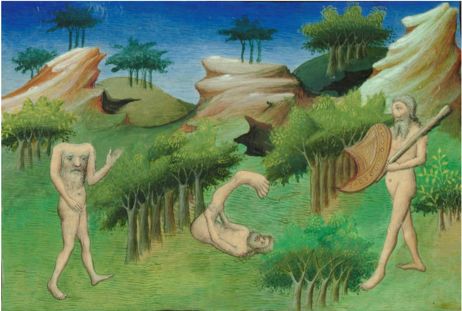
Livre des Mervellies , manuscript of Paris, Bibliothèque nationale, fr. 2810, fol. 29v (detail) https://commons.wikimedia.org/wiki/File:Fr._2810_Tav._29v.jpg?uselang=fr