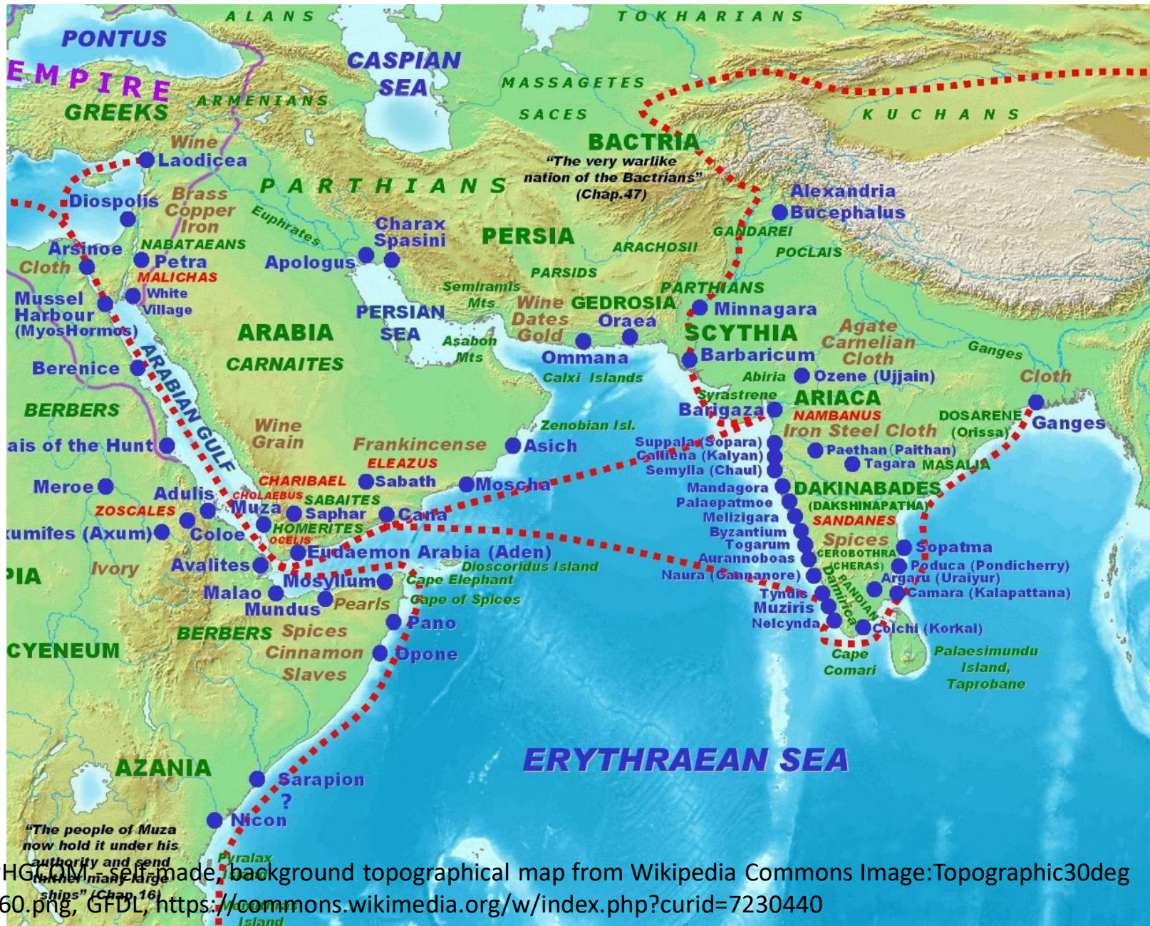
By PHGCOM, self-made background topographical map from Wikipedia Commons Image:Topographic30deg N0E60.png, GFDL, https://commons.wikimedia.org/w/index.php?curid=7230440