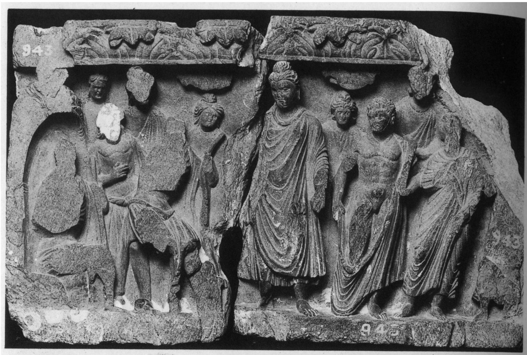
Buddha a jeho žáci, Gandhárské umění