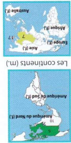
Les continents (m.)

aller (jít, jít) je vais nous allons tu vas vous allez il va ils vont aller + à (smě tam) Je vais au cinéma.