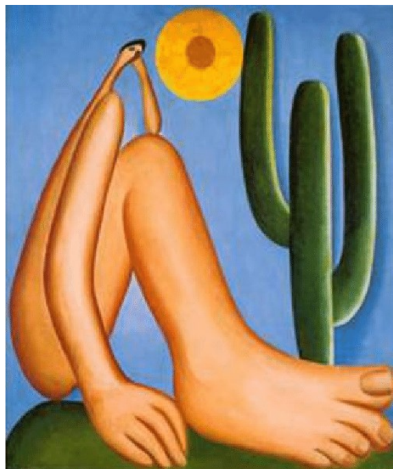
Tarsila de Amaral: Abaporu