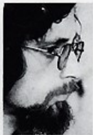
ZBIGNIEW SEIFERT housle