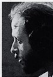
BARRE PHILLIPS kontrabas