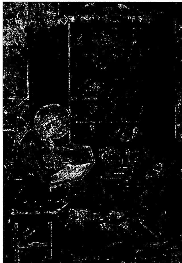
Italský písař ze 6. století při práci ( Codex Amiatinus z doby kolem roku 700; podle starší italské předlohy)

Archeologické doklady nastolují další důležitou otázku. Jestliže předměty typu spon a hřebenu měly symbolický význam, jak byly vyráběny a rozdělovány? Kontrola krále nebo obce nad důležitými symbolickými předměty by znamenala velmi odlišnou dynamiku etnicity. Mohli například králové ovlivňovat etnicitu tím, že vybírali osoby, které měly dostat předměty zvláštního významu? Odznaky vyššího statutu, jako třeba orlí spony, se jistě zhotovovaly jen v několika dílnách, asi pod královskou kontrolou. Výroční vojenské seznamy byly zřejmě pravidelným jevem gótského života a poskytovaly rámec pro distribuci od-