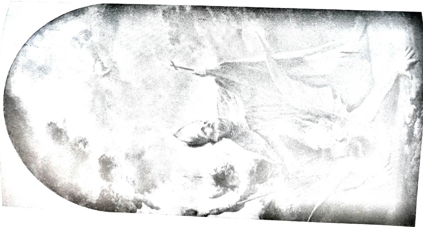
VIII. PETR BRANDL: VATY PROKOP