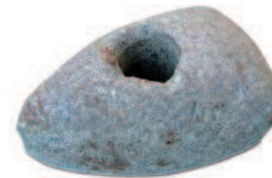
Pravěké sekeromlaty coby tzv. hromové kameny byly oblíbenými prostředky nejen při léčbě lidských a zvířecích chorob. Také chránily před požárem a bleskem, jako v případě tohoto kamenného sekeromlatu z pozdní doby kamenné (?). Jeho nálezy v krovech kovárny č. p. 106 ve Fryšavě pod Žákovou horou (okr. Žďár nad Sázavou) odhaluje jeho význam pro majitele domu v 19. století. Vzhledem k absenci osídlení z pozdní doby kamenné v okolí se bezesporu jednalo o import.