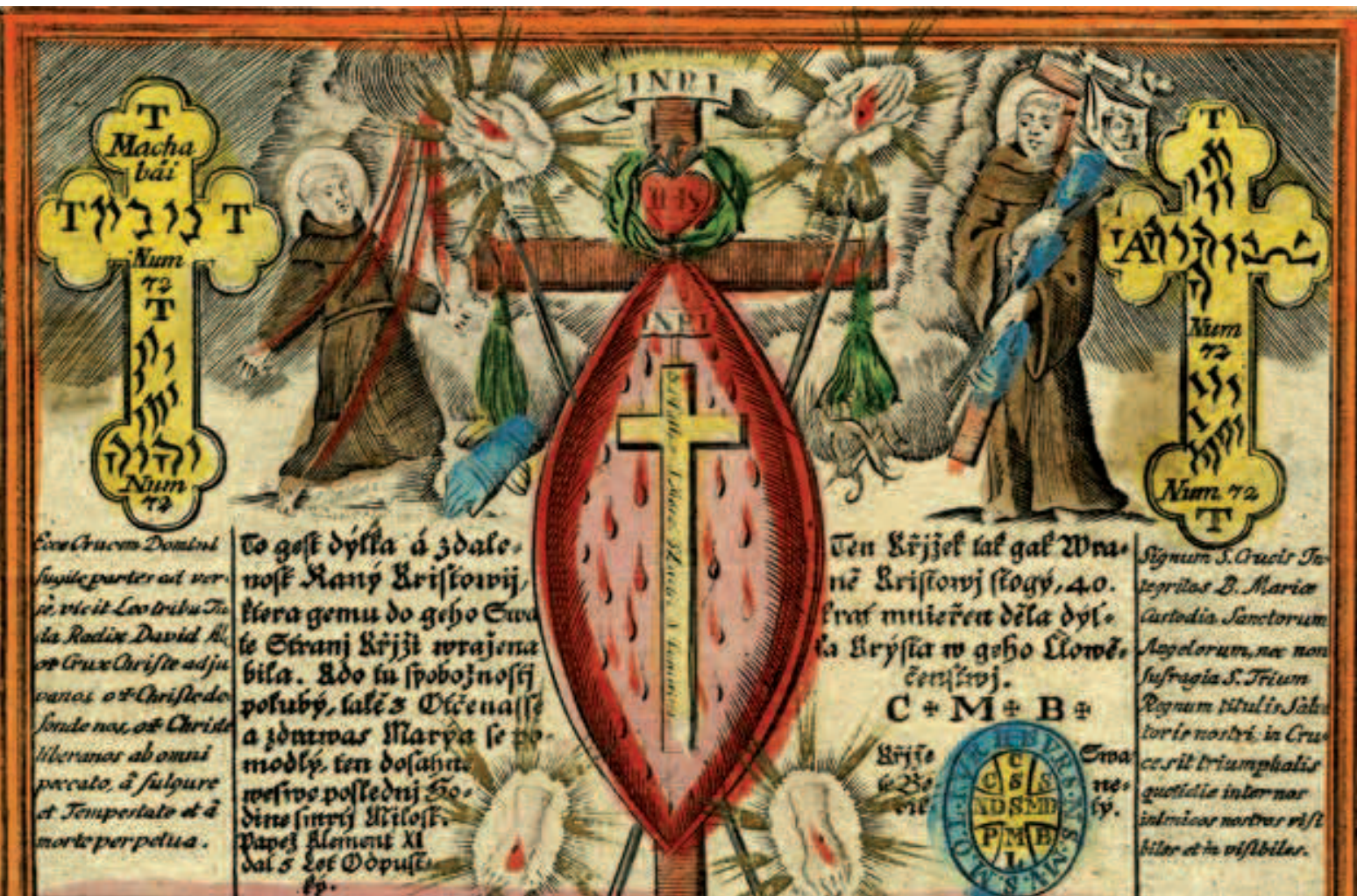
Široké spektrum ochrany měla přinést také tato délka Ježíše Krista, stavějící na křesťanské symbolice. Vedle domu chránila i toho, kdo ji u sebe nosil. Kromě mnohých jiných funkcí sloužila i preventivně proti moru.

kožní choroby, neštovice i boule modlitbou a natíráním slinou za současného zařikání: „Nerost, nerost, znamení, od Kristova zrození, židi v pátek maso jedí, ať tě také snědí.“ 80 Zatímco druhá část textu koresponduje s právě uvedeným zařikáním, první odkazuje k jinému obecně rozšířenému léčení pomocí slova, tentokrát bradavic, což nám naznačuje možný důvod širšího spektra léčených chorob u tohoto malohanáckého postupu. Také toto zařikání bradavic známe již z Erbenových záznamů. Bradavice měly být stírány bílým šátkem pod širým nebem za ustupujícího měsíce, přičemž se měly zařikávat