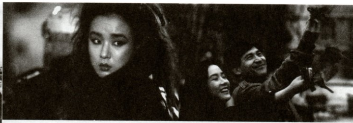
Berlínská zpráva (1991). r. Pak Kwan-su

k vybudování zavlažovacího kanálu. Mladý šlechtic z ostrova Kanghwa (1963) a Králi Čchol-jong a Pongnjo (1963) byly výpravné filmy z korejské historie. Umělecky ambicióznější černobílý širokoúhlý snímek Němý Samjong (1964) obdržel také Velký zvon a byl uveden v informativní sekci berlínského MFF; jde o adaptaci románu Na Toh-janga (1902-1927), který se v příběhu zamilovaného němeho mladíka inspiroval Hugovým Quasimodem. Ani Příběh o Taewonovi (1968) neminulo ocenění Velkým zvonem. Kvůli obscenitě byly konfiskovány jeho filmy Eunuchové (1968, II. díl 1969, o proměně kurtizán ve dvorní dámy) a Žena had (1969).