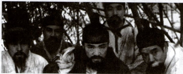
Leť vysoko, leť daleko (1991). r. Im Kwon-tek

V týlu nepřítelů (1951), Vetřelci (ruský titul Dívka partyzána , 1954), Řeka Orang (1956), Pouto naděje (1959) a spolu s režisérem Ju Won-džunem se podílel i na režii širokoúhlého barevného velkofilmu Vyprávění o Čchun-hjang (1979); všechny jmenované tituly byly uvedeny u nás. Celkem vzniklo mezi druhou světovou a korejskou válkou v obou částech země asi šedesát celovečerních snímků.