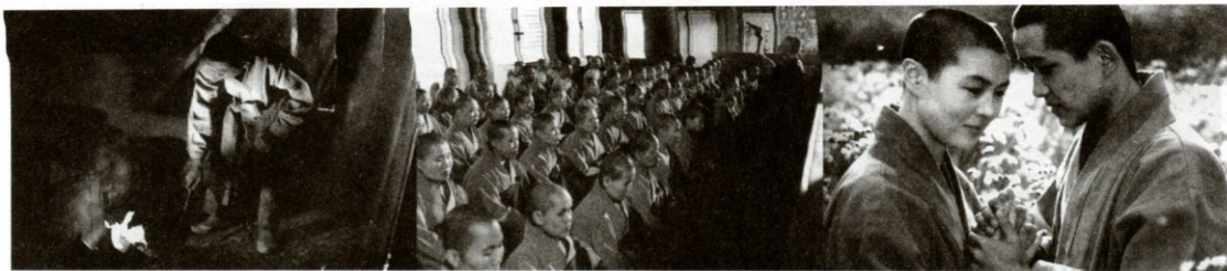
Za horou (1991), r. Čung Dži-jong

roce natočil i sociální drama Tanec vdov (1983). Za mistrovské dílo je považována jeho komedie Muž se třemi rakvemi (1987). Filmy I Čchang-hoa jsou ceněny za spojení umělecké náročnosti a diváckosti a často se věnují osudům z okraje společnosti. Autor používá ve svých filmech tradiční korejské písně, tance, křesťanské chorály a má pověst experimentátora.