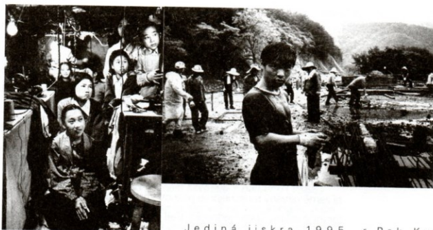
Jediná jiskra 1995, r. Pak Kwan-su

duktům, a to v kvótě platné pro každé kino: dva korejské filmy ku třem zahraničním. Znamenalo to samozřejmě i otevření korejského trhu pro filmy z jiných teritorií včetně Evropy, což dříve nebylo možné. V osmdesátých letech rostl počet kin (ze 466 v roce 1980 na 640 v roce 1986); tento proces však zároveň znamenal nahrazování velkých tisícisedadlových sál menšími projekčními místnostmi do dvou set diváků; malé sály tvořily na konci dekády už přes polovinu z celkové nabídky.