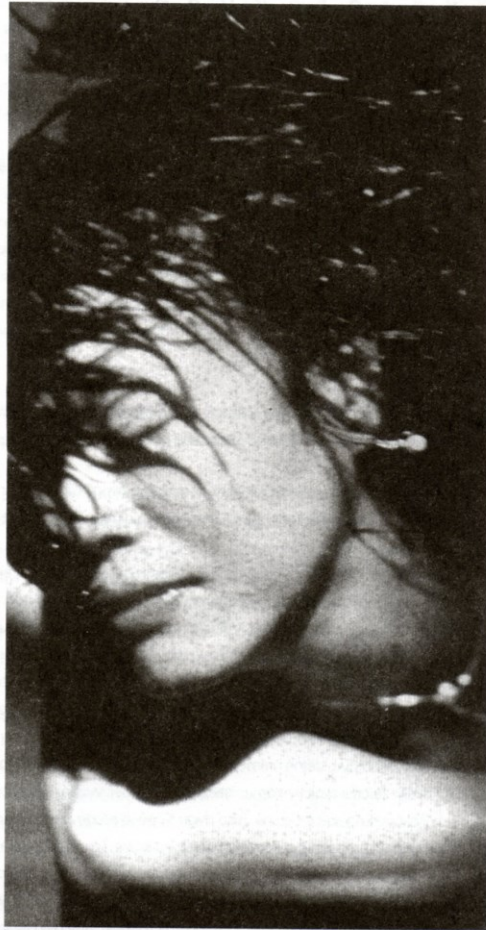
Motel Kaktus (1997), r. Pak Ki-jong

Mimořádně deštivý je i snímek Motel Kaktus (1997), jímž se debutující režisér Pak Ki-jong hodně přiblížil stylu tchajwanského režiséra Cai Min-lianga. V hotelu se v průběhu děje setká několik dvojic (některé se prostřídají); buď spolu mlčí, nebo pijí, nebo si povídají; nad vším se však vznáší perut' samoty. Sexuální scény jsou mlčenlivé, úporné, deštivé kapky kanou, pot se leskne a někde tam venku snad probíhají demonstrace, protože hrdinka si na počátku v koupelně vymývá oči od slzného plynu.