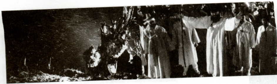
Leť vysoko, leť daleko (1991), r. Im Kwon-tek

1964 natočil stovku. K nejlepším filmům Kim Su-jonga patří Vesnice na mořském břehu (1965), Miha (1967) a Na konci podzimu (1981).