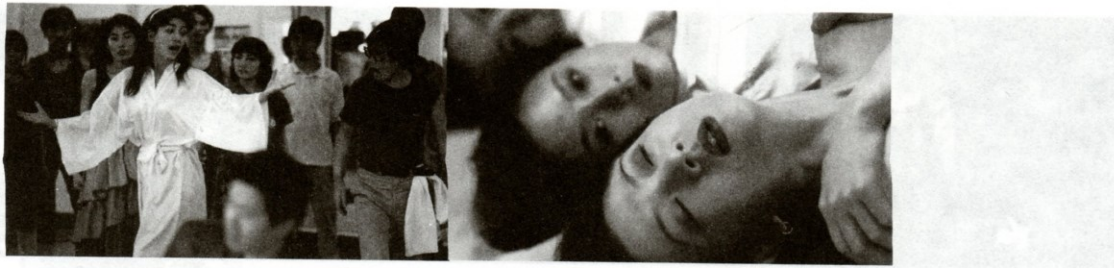
Soulská Evita (1991) r. Pak Čol-su