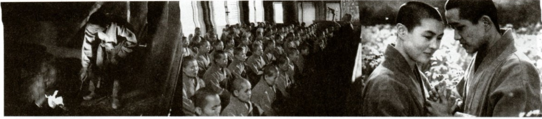
Za horou (1991), r. Čung Dži-jong

roce natočil i sociální drama Tanec vdov (1983). Za mistrovské dílo je považována jeho komedie Muž se třemi rakvemi (1987). Filmy I Čchang-hoa jsou ceněny za spojení umělecké náročnosti a diváckosti a často se věnují osudům z okraje společnosti. Autor používá ve svých filmech tradiční korejské písně, tance, křesťanské chorály a má pověst experimentátora.