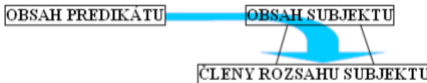
Obrázek 3. Identifikace predikátu se subjektem

Ad 1). Pravdivost je nutným atributem znalosti, nelze vědět něco, co není pravda. Pravdu chápeme jako shodu poznání a skutečnosti. Elementárním logickým útvarem, který má pravdivostní hodnotu, je soud. Soud je poznávací myšlenkový akt, spočívající v intencionální identifikaci obsahu predikátu se členy rozsahu subjektu. Odpovídá-li tato identifikace realitě, je soud pravdivý, neodpovídá-li, je nepravdivý. (Novák a Dvořák, 2011, s. 110). Soud má subjekt-predikátovou strukturu S-P, pojem na místě predikátu se přiděluje členům rozsahu pojmu na místě subjektu (individuím) prostřednictvím tohoto pojmu. Názorně si to můžeme zobrazit následujícím způsobem.