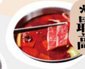
麻辣鍋湯底 約 1628大卡