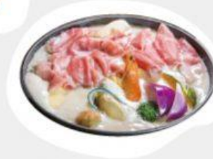
牛奶鍋湯底 約 288大卡