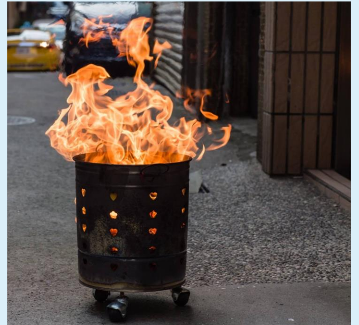
烧金纸 Ghost money