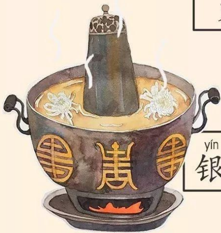
yín shòu zì guō 银寿字锅