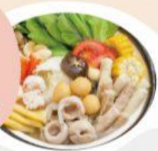
柴魚昆布鍋湯底 約 30大卡