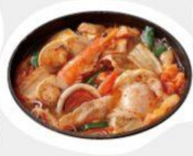
泡菜鍋湯底 約 145大卡