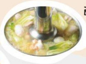
酸菜白肉鍋湯底 約 600大卡