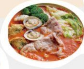
番茄鍋湯底 約 280大卡