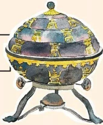
huǒ wǎn 火碗