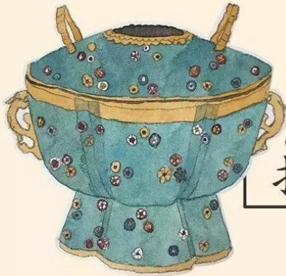
qiā sī fà láng huǒ guō 掐丝珐琅火锅