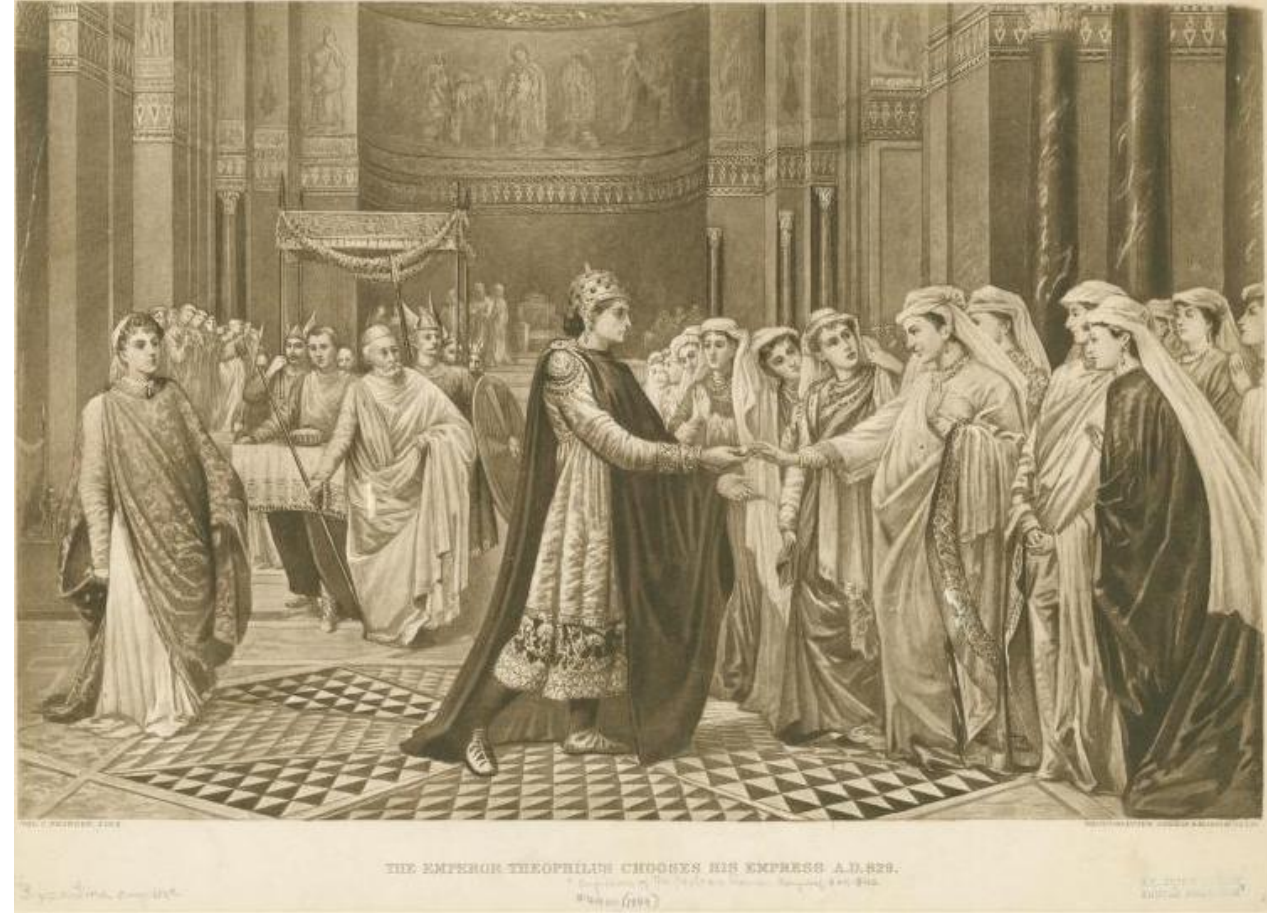
Novodobé vyobrazení soutěže nevěst pro císaře Theofila

It is not good for a woman to be beautiful; for beauty is distracting; but if she is ugly and ill mannered, without distraction it is twice as bad. It is moderately bad for a woman to have a radiant countenance, yet beauty has its consolation; but if a woman is ugly, what misfortune, what bad luck.