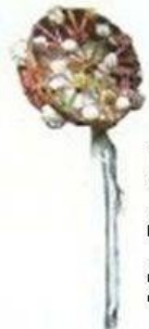
Pandeireta das Saias