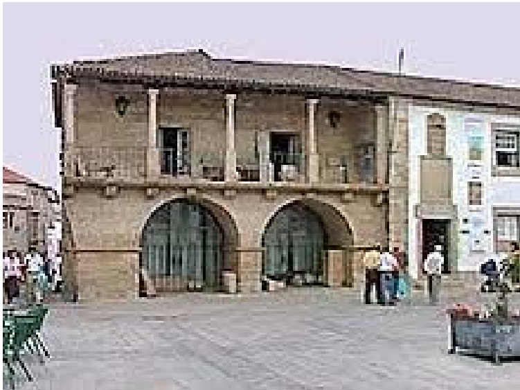
MIRANDA DO DOURO