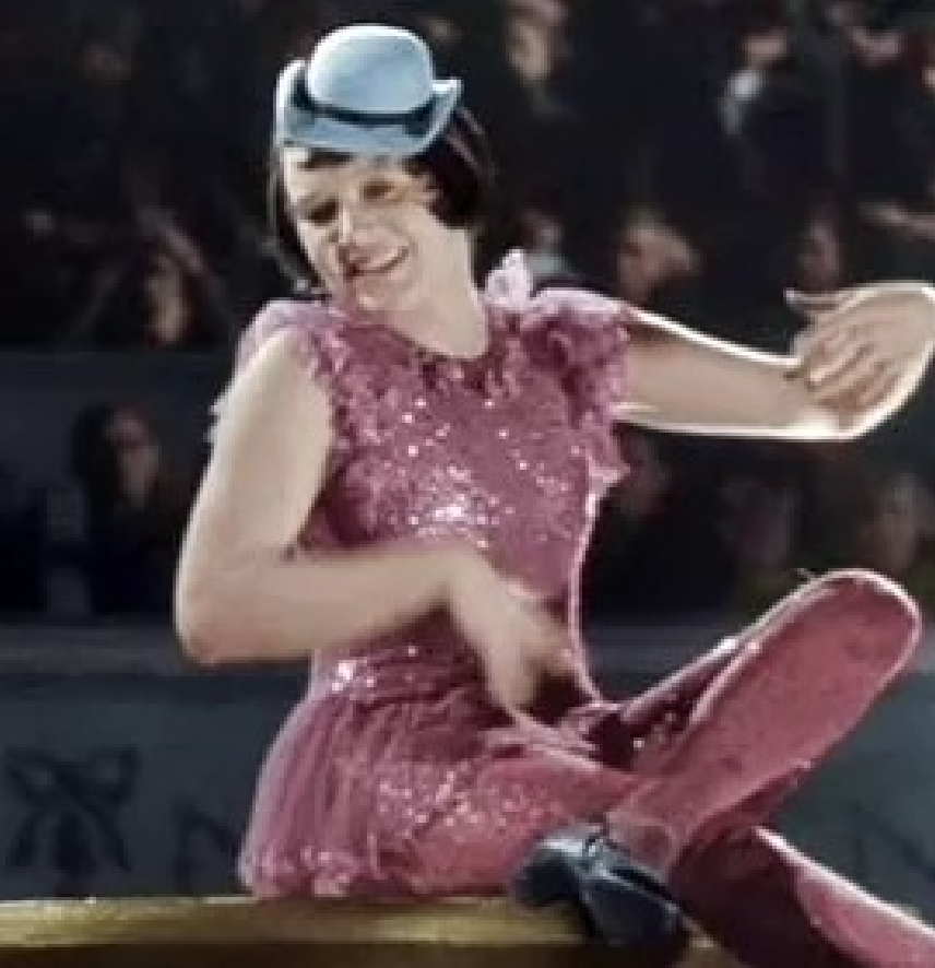
Ljubov Orlovová – Marion Dixonová (americká herečka)