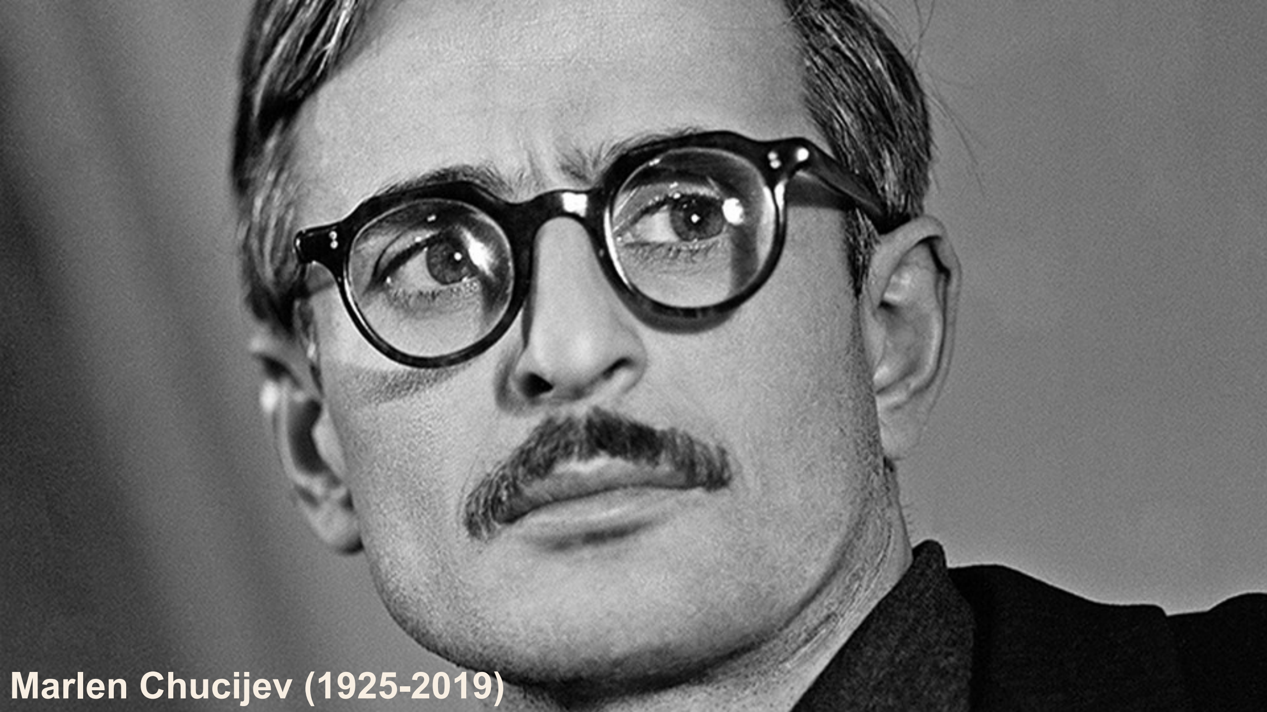
Marlen Chucijev (1925-2019)