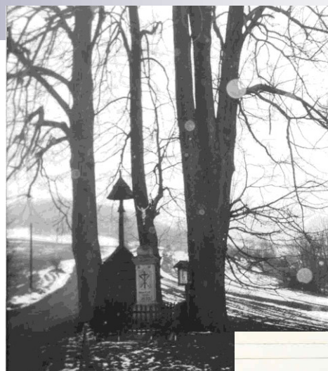
Zvonice z Lužné