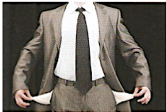
1. У нього немає грошей, йому варто більше працювати...