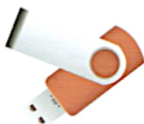
флеш карта флешка