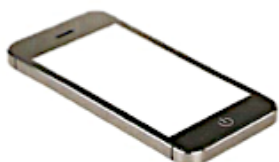
мобільний телефон смартфон