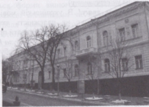
Музей Т.Г. Шевченка в Києві

Першим відомим підприємцем у цій родині був Артемії Терещенко, син чернігівського козака, який оселився в колишній гетьманській* столиці місті Глухові (нині – Сумська область). Спочатку він торгував хлібом і деревиною. Пізніше розбагатів, почав будувати цукрові заводи.