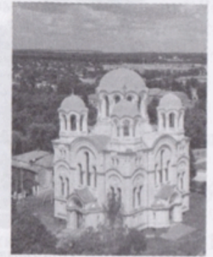
Трьох-Анастасіївський собор (м. Глухів)

На сімейному гербі родини Терещенків написаний девіз: «Прагнення до суспільної користі». Саме так і жили підприємці Терещенки. Брати дбали про гідні умови праці для своїх робітників: при кожному заводі були школа, лікарня, лазня, пральня, їдальні. Працівники мали право на безкоштовне житло і харчування. Династія Терещенків мала правило: 80 відсотків прибутку віддавати на благодійність.