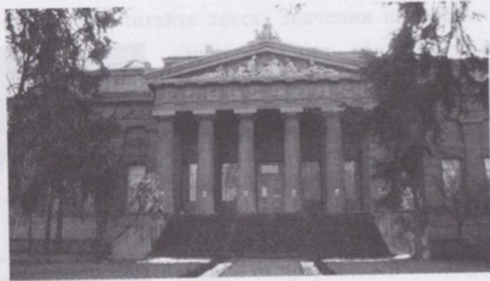
Національний художній музей України (архітектор – Владислав Городецький)

На жаль, під час революції 1917 р. багато експонатів було знищено або вкрадено.