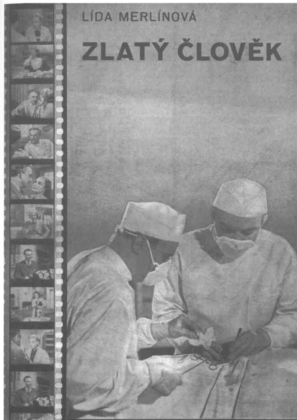
Příklad běžné nakladatelské praxe: vydávané tituly bývaly často vyzdobeny fotografiemi z filmových verzí.