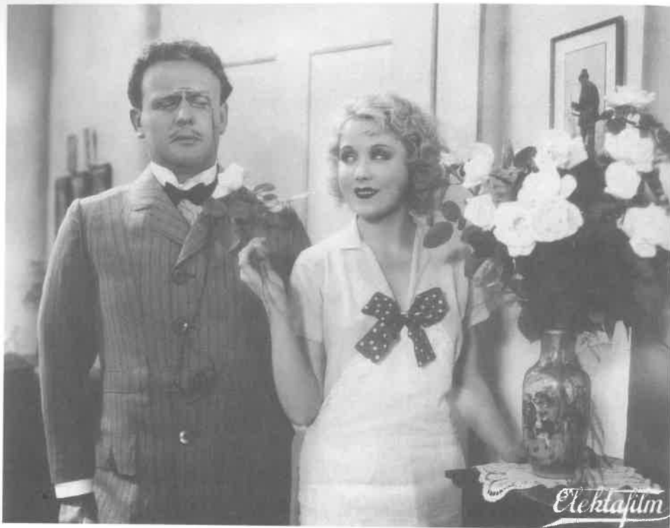
Zázračná proměna roztržitého staromódního profesora v ideál dívčích srdcí s bezvadným moderním zevněškem a sebevědomým vystupováním. V přímé závislosti na této proměně se vyvíjejí reakce jeho partnerky.