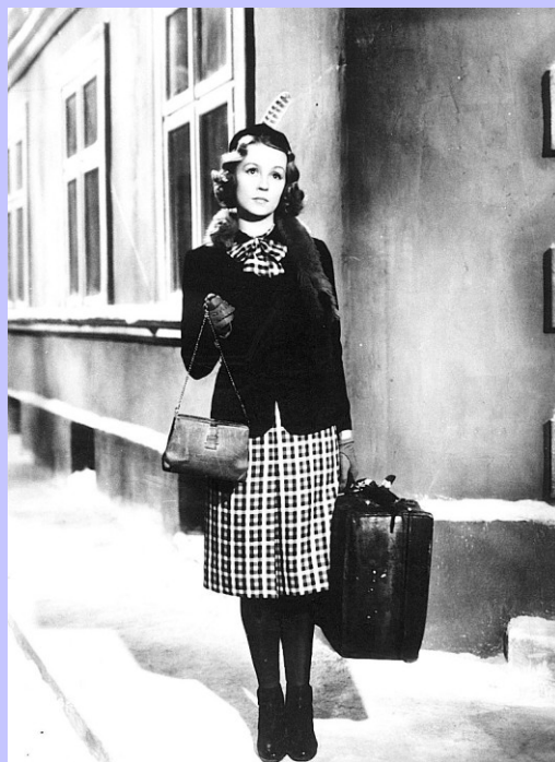
Nataša Gollová, eine der beliebtesten und künstlerisch bedeutendsten tschechischen Filmschauspielerinnen, in der Rolle der naiven, von Sehnsucht nach Filmruhm besessenen Fanni. Představitelkou naivní Fanny, která je posedlá po filmové slávě, je Nataša Gollová, jedna z nejoblíbenějších a umělecky nejvýznamnějších českých hereček.