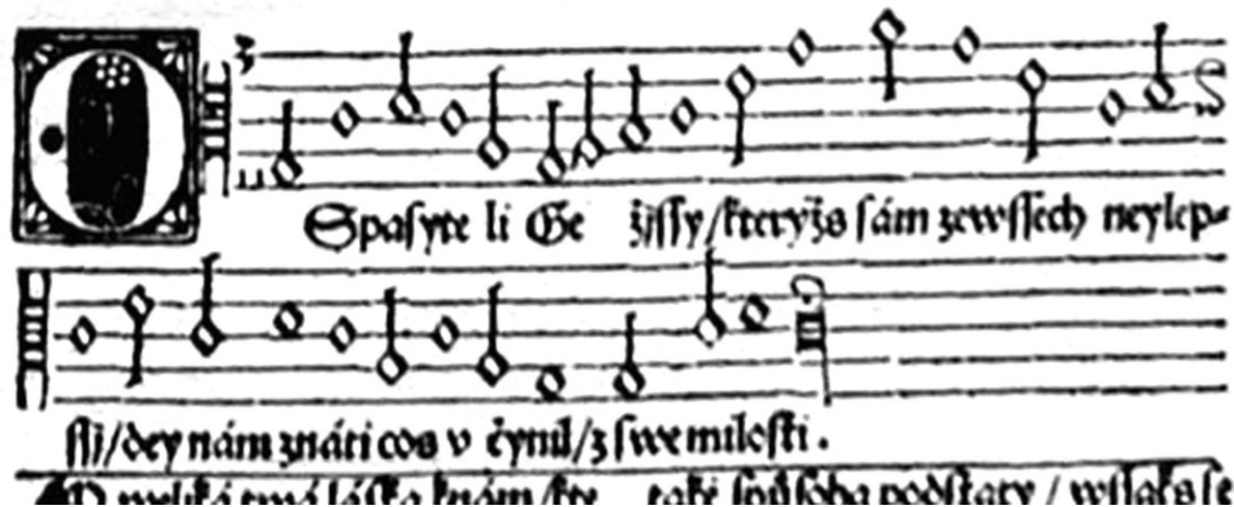
Jan Roh: Písně chval božských 1541 (kancionál Jednoty bratrské)