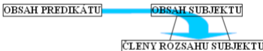
Obrázek 3. Identifikace predikátu se subjektem

Ad 1). Pravdivost je nutným atributem znalosti, nelze vědět něco, co není pravda. Pravdu chápeme jako shodu poznání a skutečnosti. Elementárním logickým útvarem, který má pravdivostní hodnotu, je soud. Soud je poznávací myšlenkový akt, spočívající v intencionální identifikaci obsahu predikátu se členy rozsahu subjektu. Odpovídá-li tato identifikace realitě, je soud pravdivý, neodpovídá-li, je nepravdivý. (Novák a Dvořák, 2011, s. 110). Soud má subjekt-predikátovou strukturu S-P, pojem na místě predikátu se přiděluje členům rozsahu pojmu na místě subjektu (individuím) prostřednictvím tohoto pojmu. Názorně si to můžeme zobrazit následujícím způsobem.