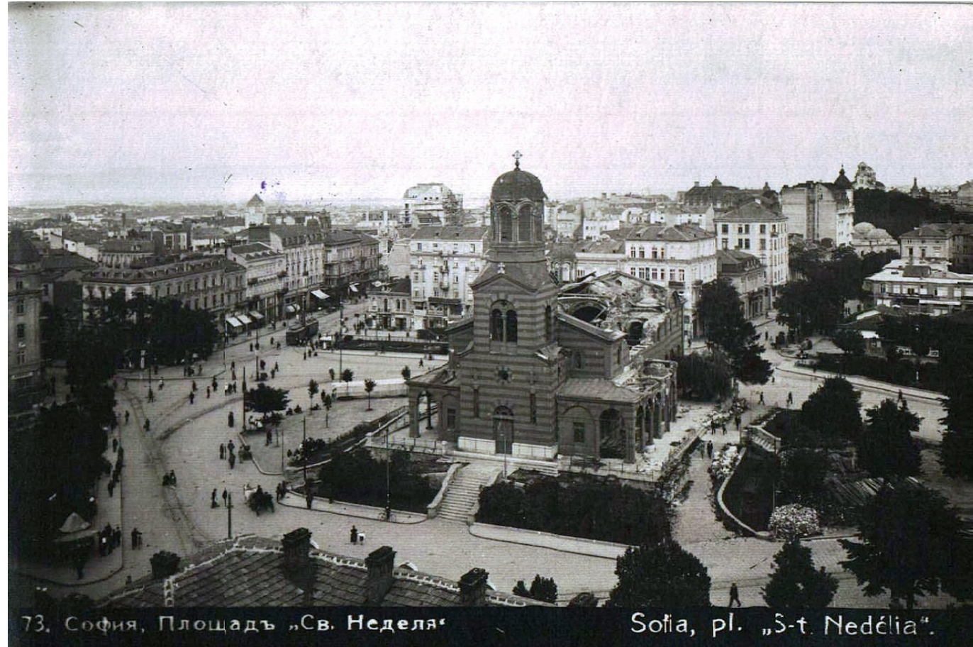
73. София, Площадъ „Св. Неделя“