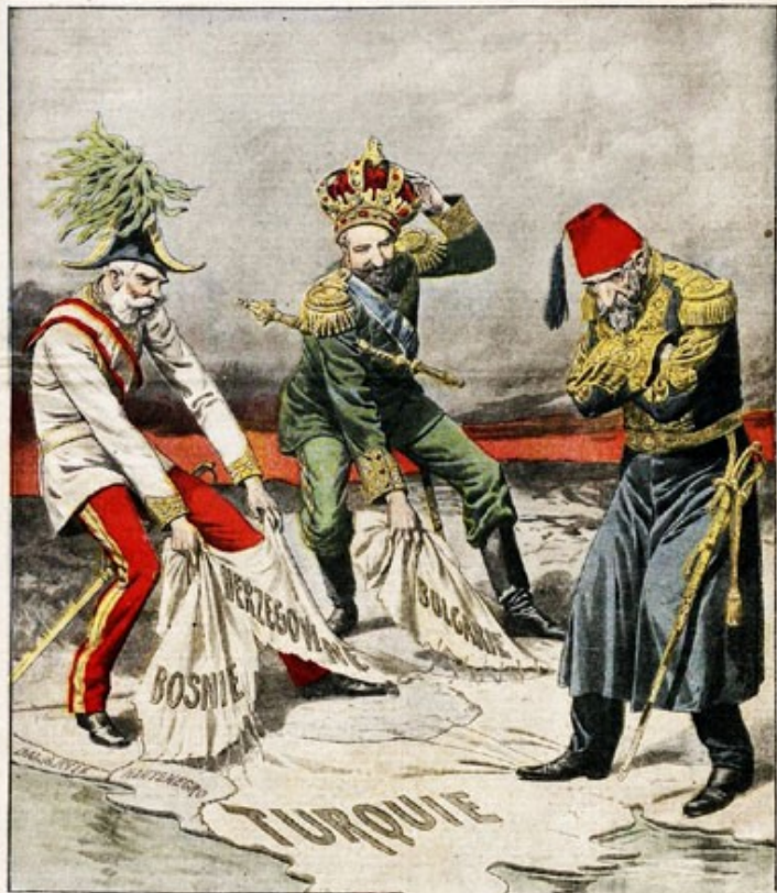
LE REVEIL DE LA QUESTION D'ORIENT La Bulgarie proclame son indépendance. — L'Autriche prend la Bosnie et l'Herzégovine

Le Petit Journal 5 CENTIMES SUPPLÉMENT ILLUSTRÉ 5 CENTIMES ABONNEMENTS Cinq fois par semaine 5 centimes Le Petit Journal agricole, 5 cent. — La Mode du Petit Journal, 10 cent. Abonnement : 12, 24, 36, 48, 60, 72, 84, 96, 108, 120, 132, 144, 156, 168, 180, 192, 204, 216, 228, 240, 252, 264, 276, 288, 300, 312, 324, 336, 348, 360, 372, 384, 396, 408, 420, 432, 444, 456, 468, 480, 492, 504, 516, 528, 540, 552, 564, 576, 588, 600, 612, 624, 636, 648, 660, 672, 684, 696, 708, 720, 732, 744, 756, 768, 780, 792, 804, 816, 828, 840, 852, 864, 876, 888, 900, 912, 924, 936, 948, 960, 972, 984, 996, 1000. Les annonces se font par cartes Ce supplément paraît dans tous les bureaux de poste DIX CENTIMES ANCIEN DIMANCHE 18 OCTOBRE 1908 Numéro 510