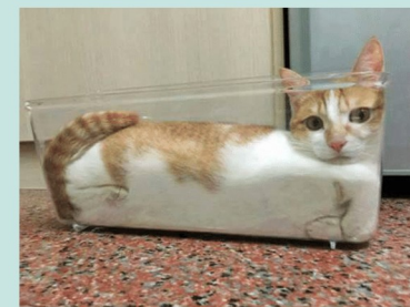
Further proof cats are liquid.