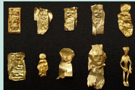
“guldgubbar” -více lokalit, mladší DSN a doba vendelská (ca. 600-800)

Také distribuce theoforických toponym ve Skandinávii příliš neodpovídá významu, který je konkrétním božstvům přisuzován v dochovaných literárních památkách, je tak patrné, že různé druhy pramenů, navíc pocházející s různých kontextů, nemusí být vzájemně kompatibilní (dísy, Njord, Ull velmi časté, Frey, Ódin a Thór spíše regionálně)