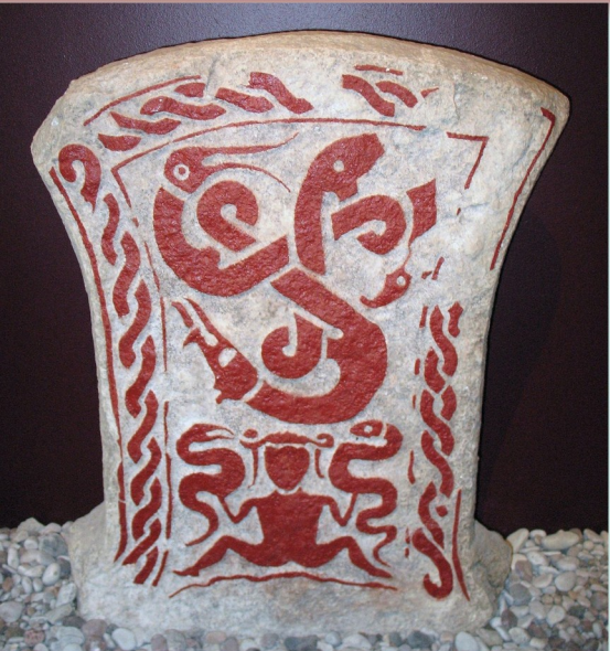
Kámen 3 ze Smiss, 400-600