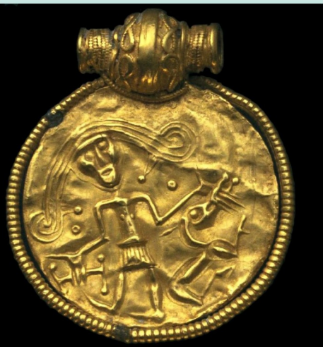
Brakteát z Trollhättan - DSN, Týr a Fenrir?

„obři“ – jotunové ( jotnar ) přírodní bytosti, ztělesnění živlů a přírodních jevů, také reprezentují vše stojící mimo lidskou zkušenost a kulturu – opozice vůči bohům, jejich jména často naznačují, že jsou špinaví, chlupatí, škaredí, hloupí a hluční, málokdy popisovaní podrobně, ale charakteristická je síla a lstivost, někteří učení, případy dvoření a sňatků mezi bohy a jotuny – asi velká různorodost, s lidmi moc neinteragují, reprezentace „jiného“ – možná také jiných kultur, např. Sámů,