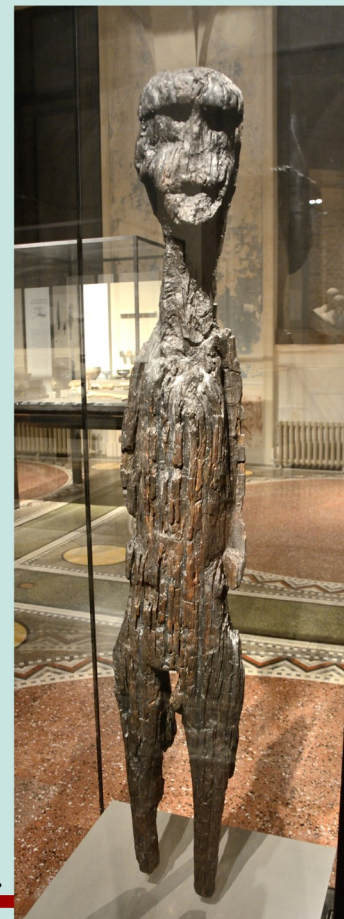
Altfriesack, 5. stol.