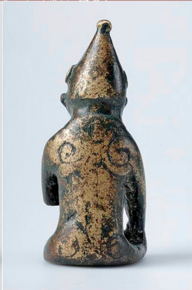
“Ódin/Freyja” z Lejre ca. 900