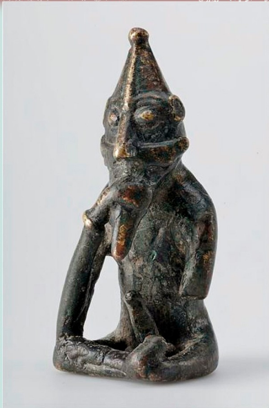
“Frey” z Rällinge, ca. 1000