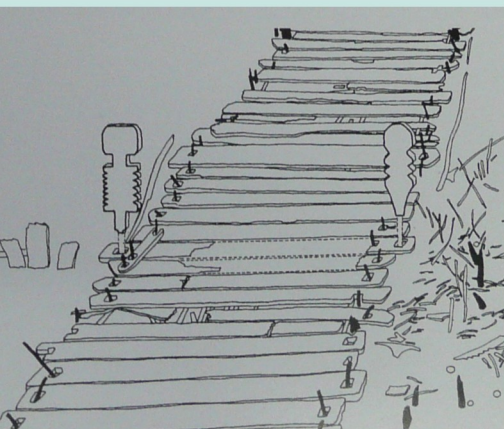
Wittemoor, 135 BC

problematická je identifikace konkrétních božstev s figurální hmotnou kulturou, většinou není jak určit, zda se skutečně jedná o některého z „bohů“ nebo jinou nadlidskou bytost, mýtického hrdinu, krále nebo „obyčejného“ člověka. Navíc, germánský „panteon“ nelze chápat jako ucelený a neměnný systém, kde měl každý „bůh“ jasně vymezené funkce a atributy, s nimiž byl spojován vždy a všude, proto i interpretace založené na zdánlivě „jasných“ attributech mohou být zavádějící