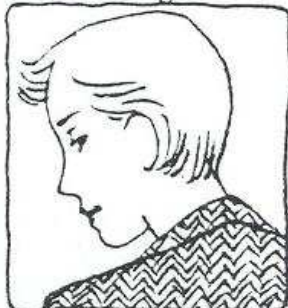
Hon har kort ljusst hår.