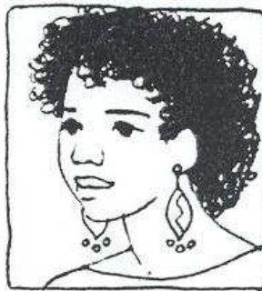
Hon har mörkt lockigt hår och stora örhängen.