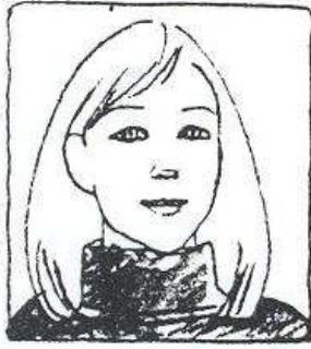
Hon har långt ljusst hår.