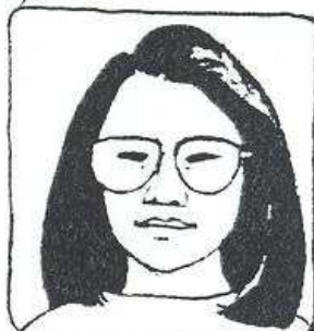
Hon har långt mörkt hår och glasögon.