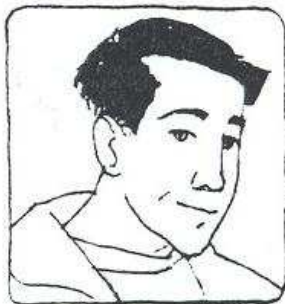
Han har kort mörkt hår.