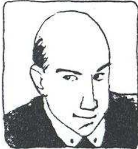
Han är flintskallig.