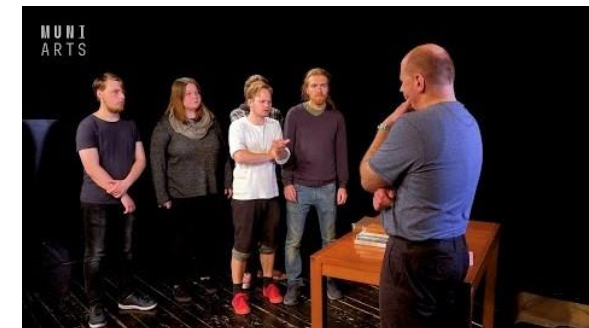
Stručný přehled nejslavnějších myslitelů, kteří dokazovali existenci boha, a především jejich motivace. ( https://www.youtube.com/watch?v=nxrHdw-MA4s&t=4s )