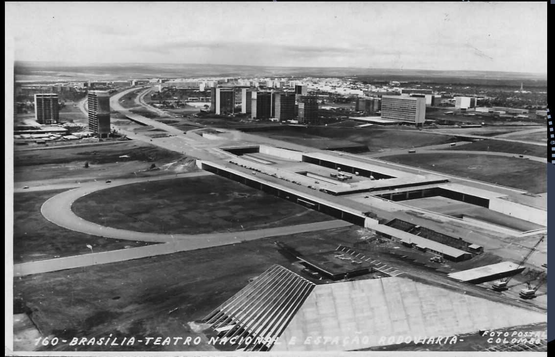
160 - BRASÍLIA - TEATRO NACIONAL E ESTAÇÃO RODOVIÁRIA -