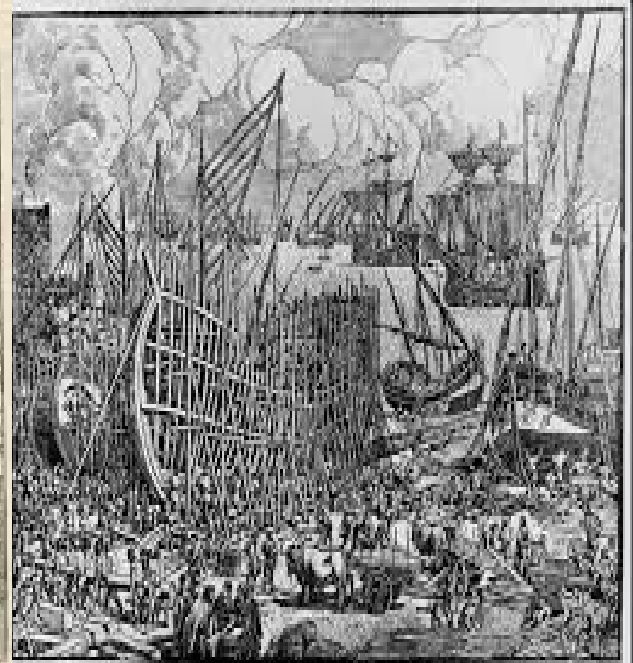
DESIGNED BY ROBERT DODD 1840