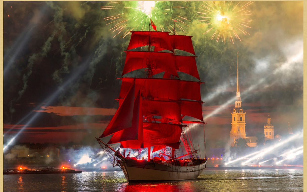
Праздник выпускников «Алые паруса»