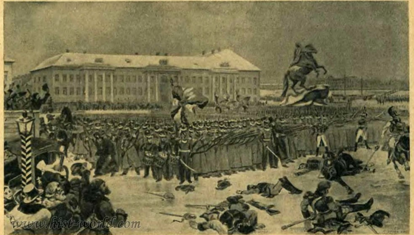
Восстание декабристов на Сенатской площади.