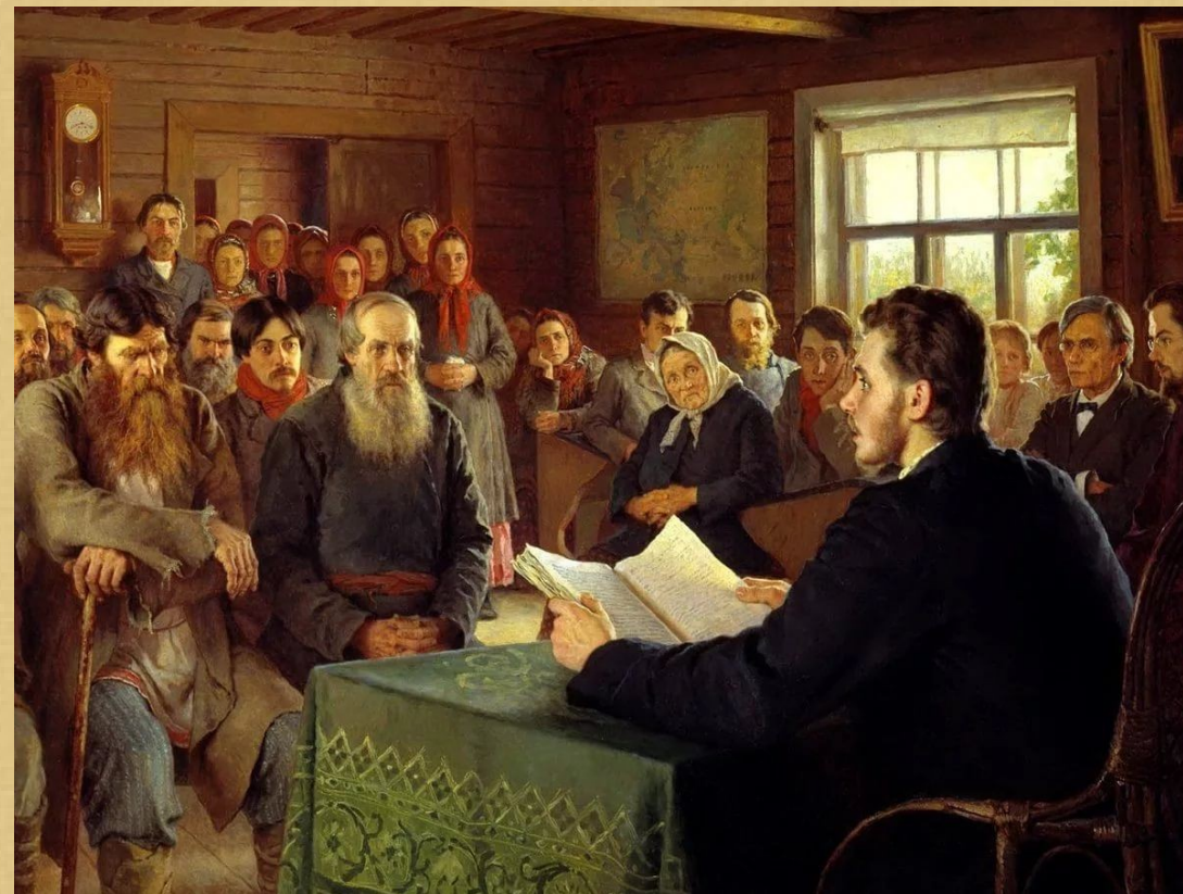
Хождение в народ