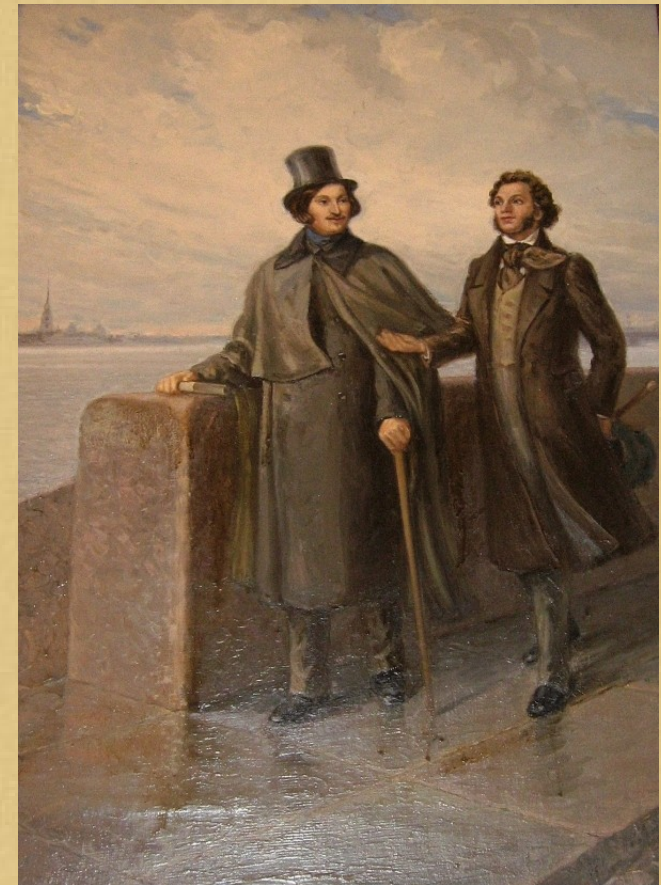
Гоголь и Пушкин