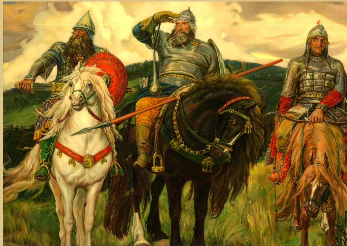
«Богатыри», картина В. М. Васнецова