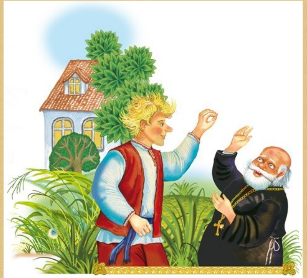
«Сказ о попе и о работнике его Балде», А. С. Пушкин