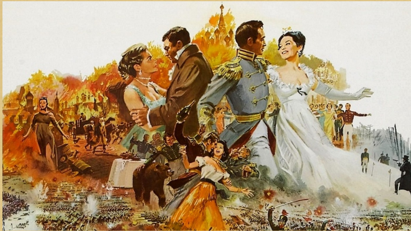
Сцены из «Войны и мира»