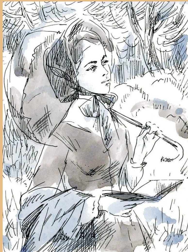
Иллюстрация к повести «Первая любовь»