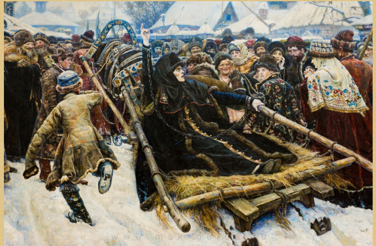
«Боярыня Морозова», картина В. И. Сурикова