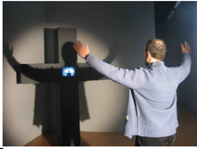
Peter Weibel (1973)