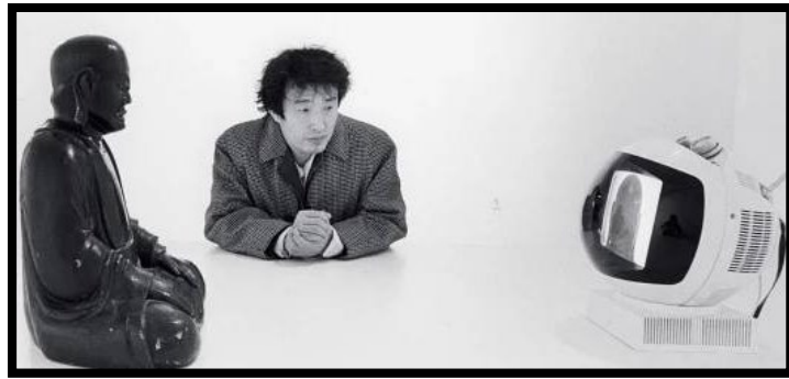
Nam Jun Paik