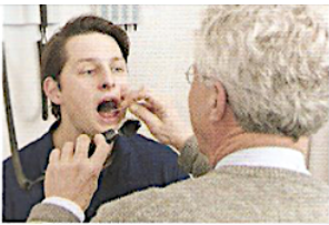
У нього ангіна.