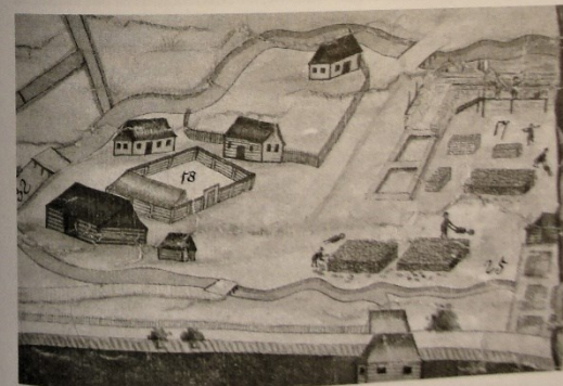
18. Stavební práce.