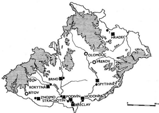
Obr. 1. Morava. Přemyslovské správní hrady (■) v jejichž blízkosti se nalézají starší slovanská hradiště (●). Otazník uveden u lokality, kde tento vztah není zřejmý. Ostatní významné přemyslovské správní hrady (○). Šrafováním vyznačena vrstevnice 500 m n.m. – Moravia. Přemysl-dynasty admi-

Obdobnou situaci lze sledovat i na Moravě, kde byla celá řada moravských hradů přemyslovského období postavena v nevelké vzdálenosti od starších hradišť zpravidla velkomoravského stáří. Vytvoření sítě těchto nových hradů, které se nacházejí především v Pomoraví a Podyjí, je dáváno do souvislosti s Břetislavovou správou Moravy, kterou dostal na starost po jejím ovládnutí Přemyslovci po roce 1018 (Sláma 1991).