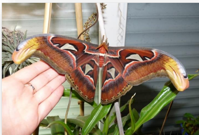
Attacus atlas .

než já, už by jistě uměli dodat nějakou působivou legendu, proč takovýto živočich už dávno nevyhynul, a jeho excesivní tvarovost, barevnost i velikost by nejspíš interpretovali jako vedlejší produkt jiných evolučních procesů s argumentem, že i zcela nepřiléhavá teorie je lepší než žádná. Proč se věří, že přírodní výběr někdy dolaďuje naprosté minucióznosti a jindy toleruje motýla doslova jako vrata, už by se nějak elegantně obešlo. Já jsem se omezil na to, co biolog dbalý své cti nikdy nečiní, na žasnutí, i když vím, že správný interpretační postup v takovémto případě je proces banalizace. Úplně ve skrytu duše si myslím něco o aktivním sebedesignování živých organismů, ale to se myslet nesmí, takže pssst. Ostatně jako živý pomník sebe sama poletuje Attacus atlas tropickou Asií relativně hojně podnes. Na fotografii to není příliš patrné, ale při pozorování živého exempláře brzy postřehneme, že se jízlivě šklebí.