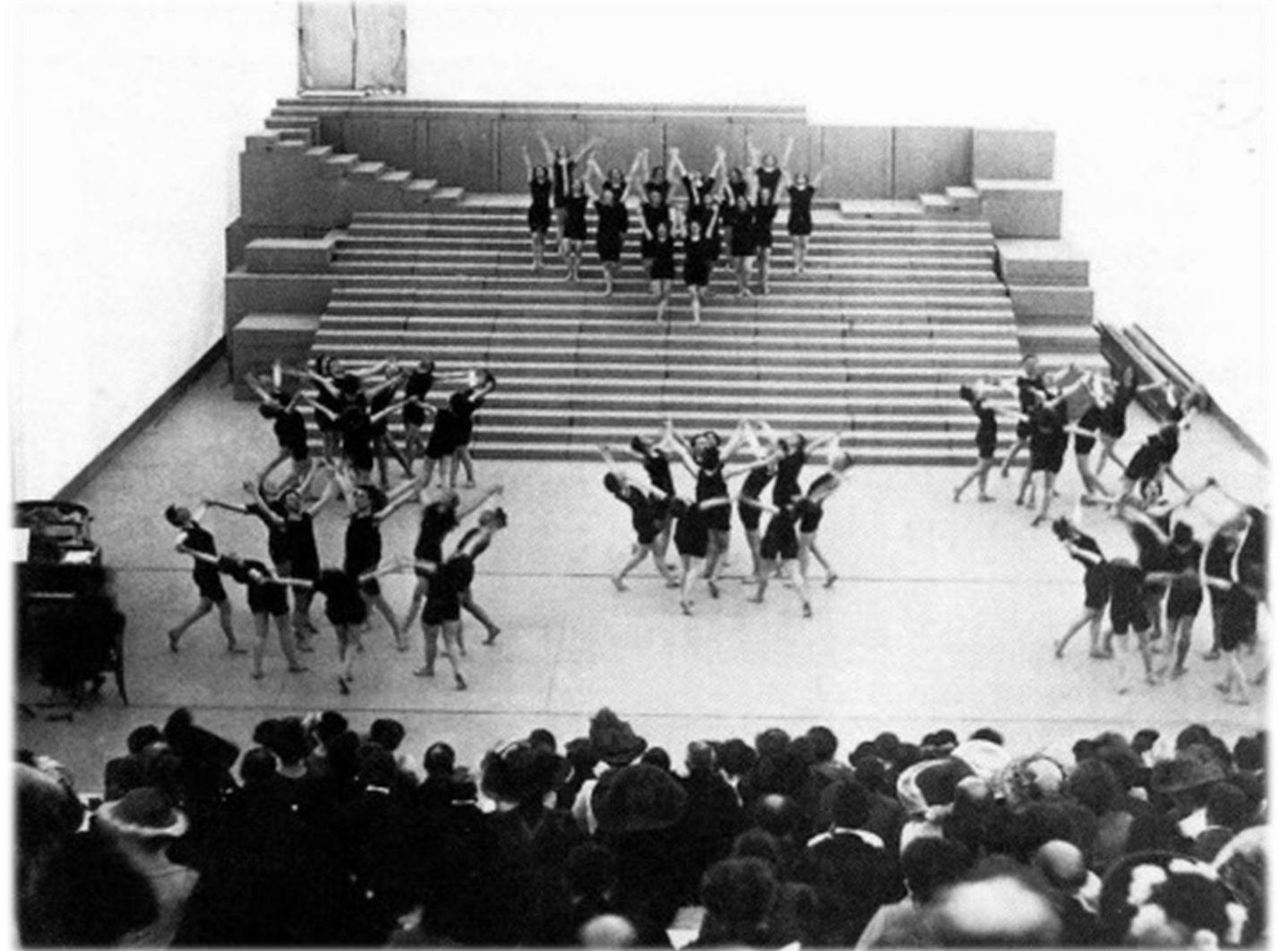
https://vimeo.com/316625164 Festspielhaus, Hellerau: Great Hall and Appia's Scenography in Second Life