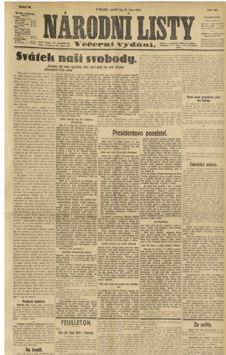
Titulní list večerního vydání Národních listů (knihovna FSV UK)

společenském životě, sexu, hojnou inzercí i soutěže. Ženám byl určen týdeník Večery pod lampou s romány typu „jak chudé děvče ke štěstí přišlo“.