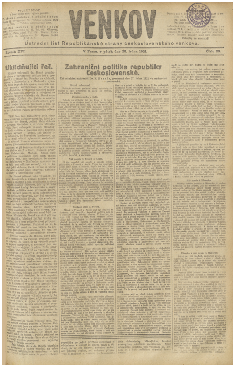
Titulní list raníku Venkov (knihovna FSV UK)