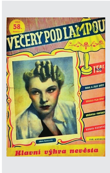
Titulní list týdeníku Večery pod lampou