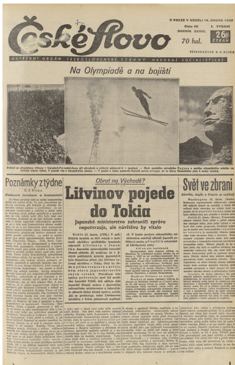
Titulní list deníku České slovo