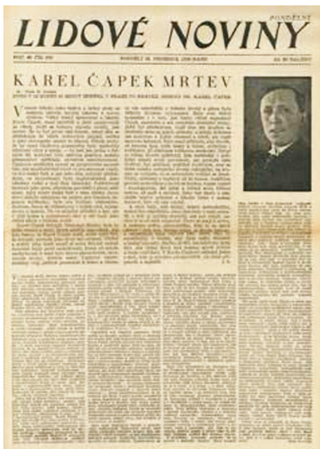
Lidové noviny s oznámením o úmrtí K. Čapka