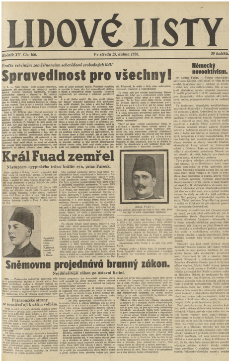
Titulní list deníku Lidové listy (knihovna FSV UK)