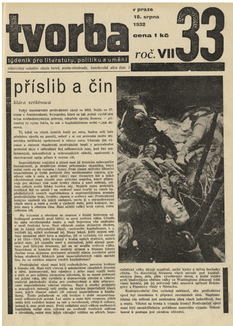
Titulní list časopisu Tvorba