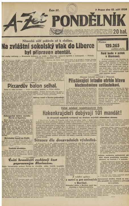
Titulní list deníku A-Zet (knihovna FSV UK)

periodika. Praxe postupně vedla k tomu, že se tituly shromažďovaly v koncernech, které tiskly jak orgány politické – což byly většinou raníky – tak večerníky, kde se více hledělo na pestřejší skladbu. Koncerny vydávaly také takzvané hlavičkové listy, kdy se název odlišoval, ale obsah býval totožný, někdy s drobnými krajovými nuancemi. Tiskly také časopisy určené různým skupinám čtenářů (například ženám, mládeži, dětem).