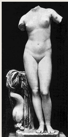
Aphrodite of Cyrene