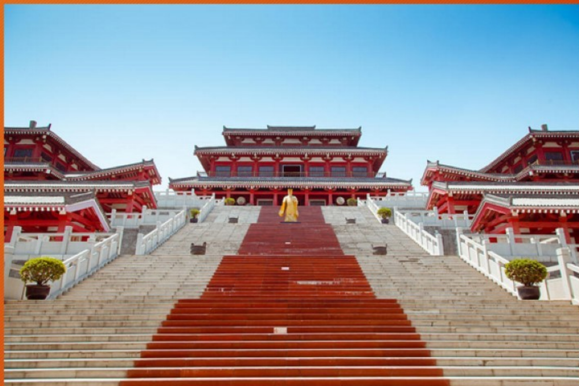
Palác E-pchang - dnešní zrekonstruovaná podoba